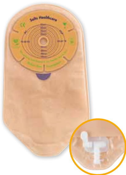
Urostomipåse, fram- och baksida

Ibland dröjer det några dagar innan tarmen kommer igång med avföring igen.