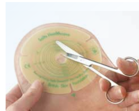
Klippa hål i stomiplattan